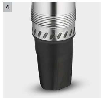
4 Abstandsfuß als Installationshilfe