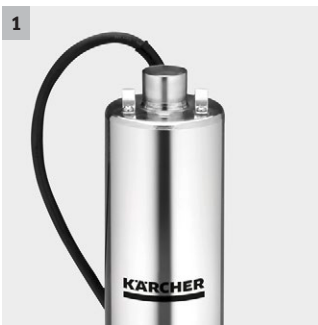
1 Pumpengehäuse und Gewindestutzen aus Edelstahl