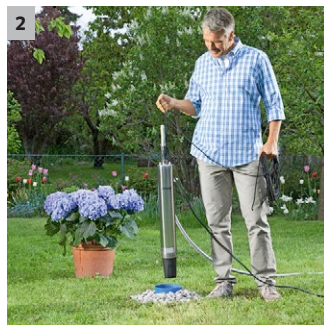
2 30 Meter Anschlusskabel