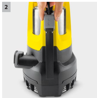
2 Czujnik poziomu wody