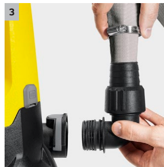
3 Quick Connect