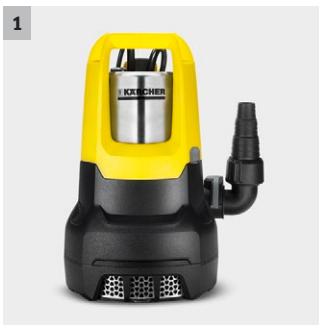
1 Ceramiczny pierścień uszczelniający.